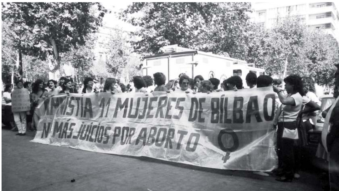
1978an estatuan egindako konzentrazioetako bat abortoa leporatutako 11 emakumeen amnistiaren alde.